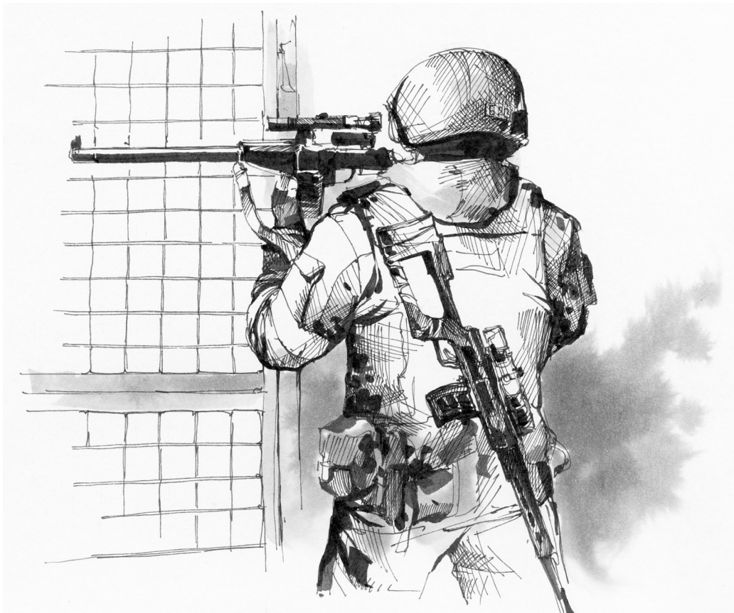
Снайпер. Запорожская АЭС, март 2022