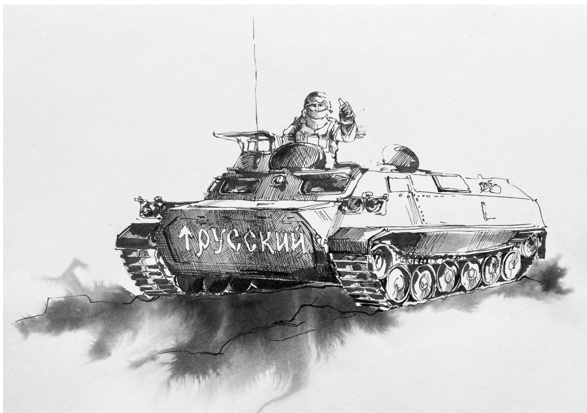
Русский. Волноваха, март 2022