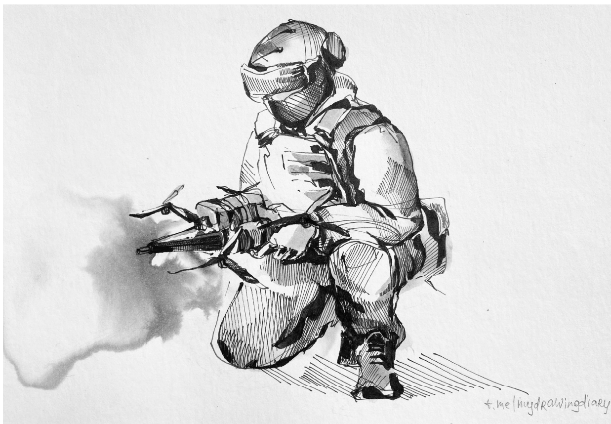
Дрон-камикадзе. Боец ВДВ на Северском направлении