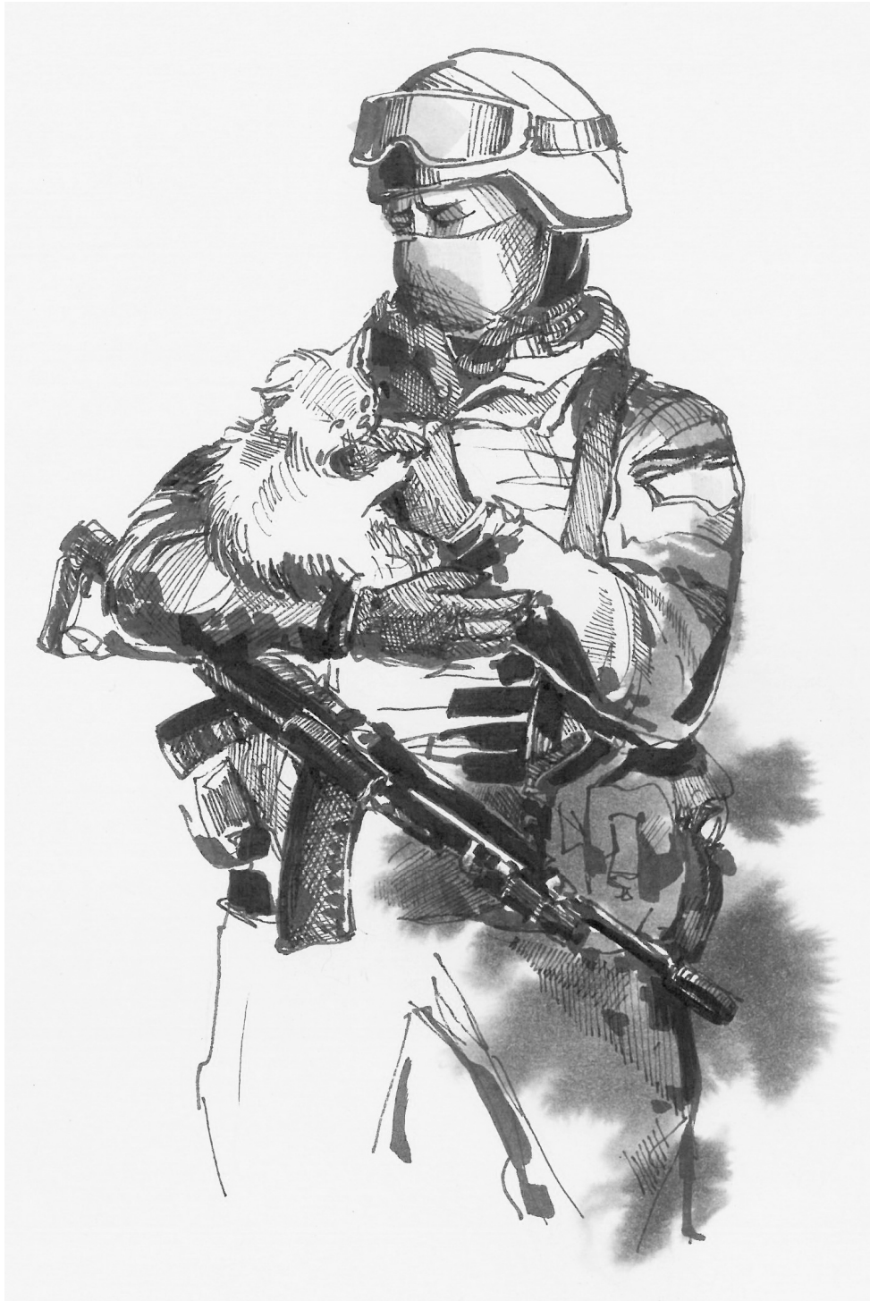
Кот. Киевская область, март 2022