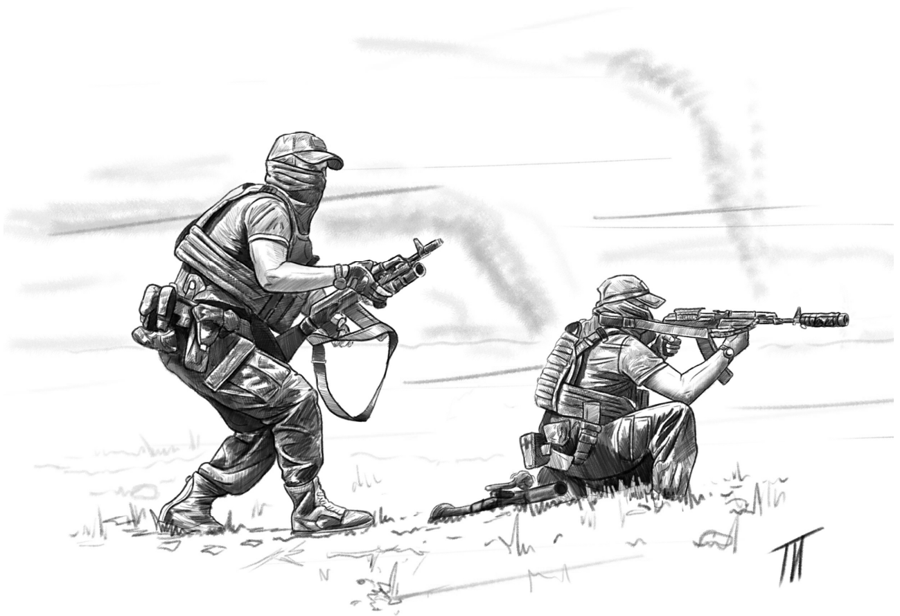
«Герои Харьковского фронта»