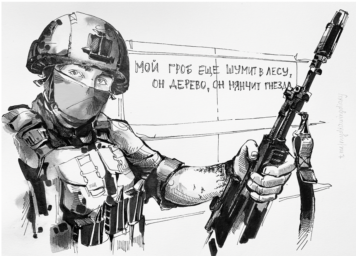
Велес, который тихонько пишет