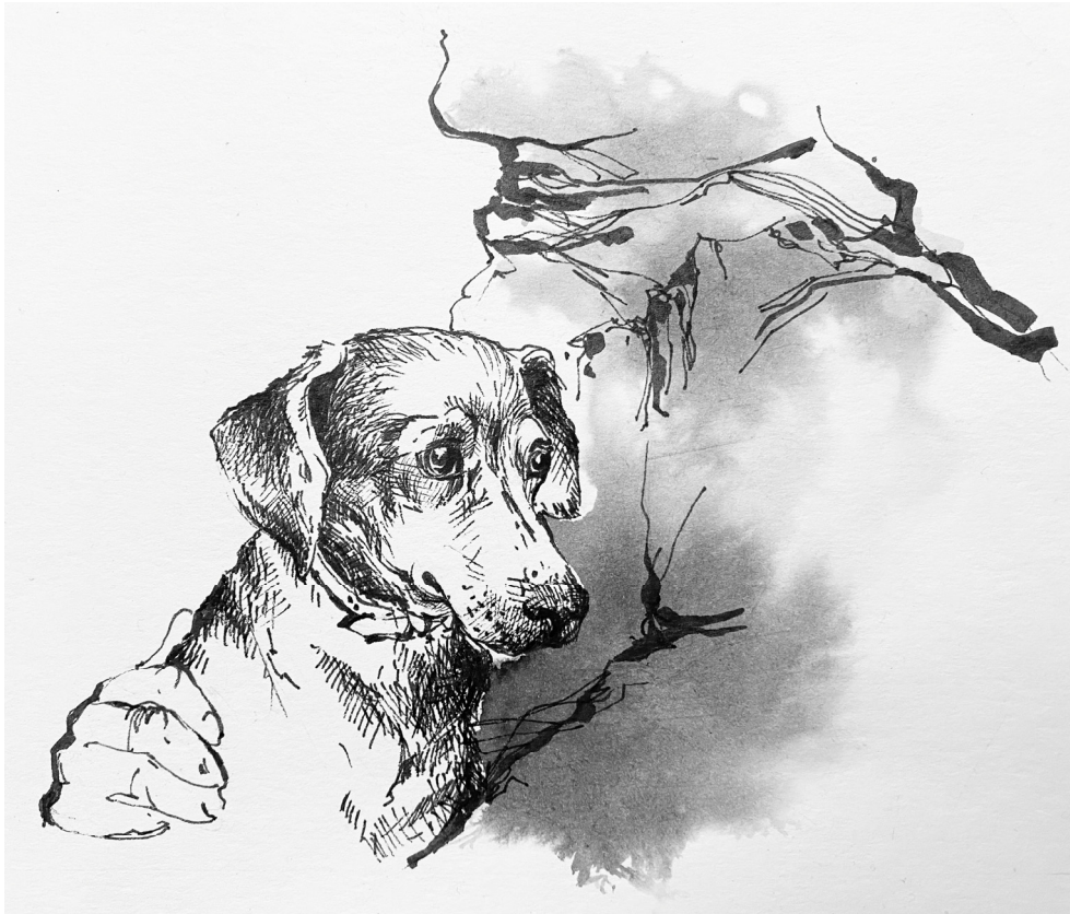
Человек. Пункт временного размещения в ДНР, март 2022