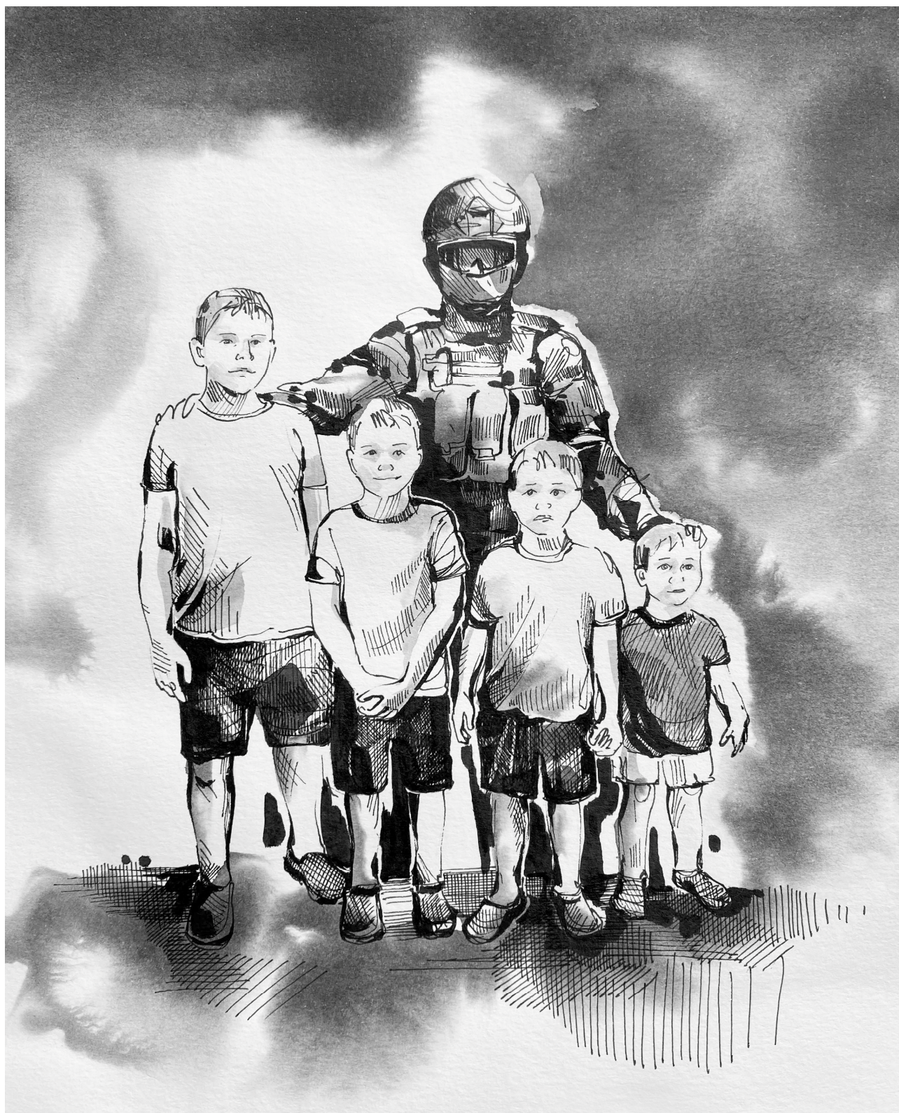
Замкомандира разведподразделения перед отправкой в зону СВО с четырьмя сыновьями